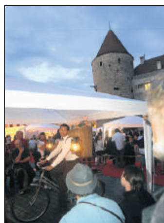
La foule s'est massée hier soir autour des pavillons-théâtres.